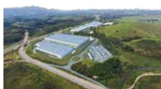
Golgi Duque de Caxias